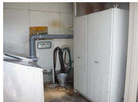
充填式微生物脱臭装置(大型)