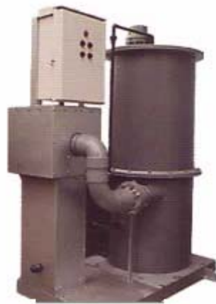
充填式微生物脱臭装置 TYK型

しかし、厳しい環境下での使用を想定し、脱臭装置をオプションでご用意しております。